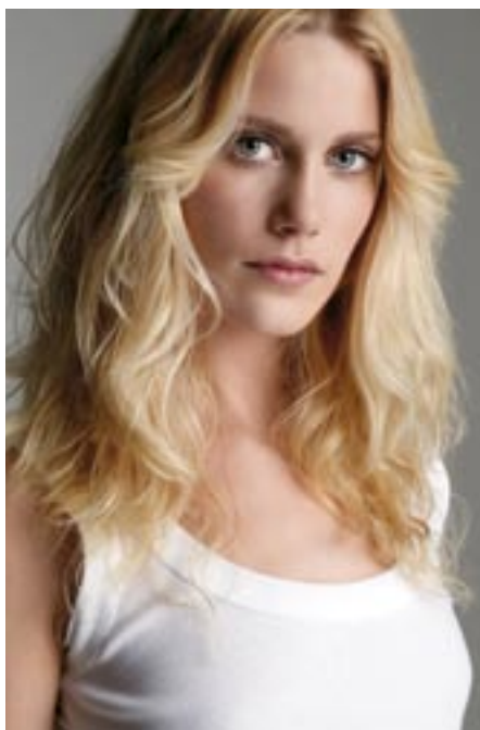
Ook met kleine borsten kom je in de finale van Hollands Next Top Model...