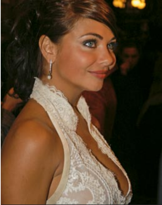
Zelf weet ze haar grotere boezem aan de pil

Slechts 18% zou zich bij een volledige vergoeding wél zouden laten opereren. Daarnaast is er ook een relatief grote groep twijfelaars. Een kwart (24%) van de respondenten weet nog niet zeker of ze zich al dan niet zal laten opereren met een volledige vergoeding.