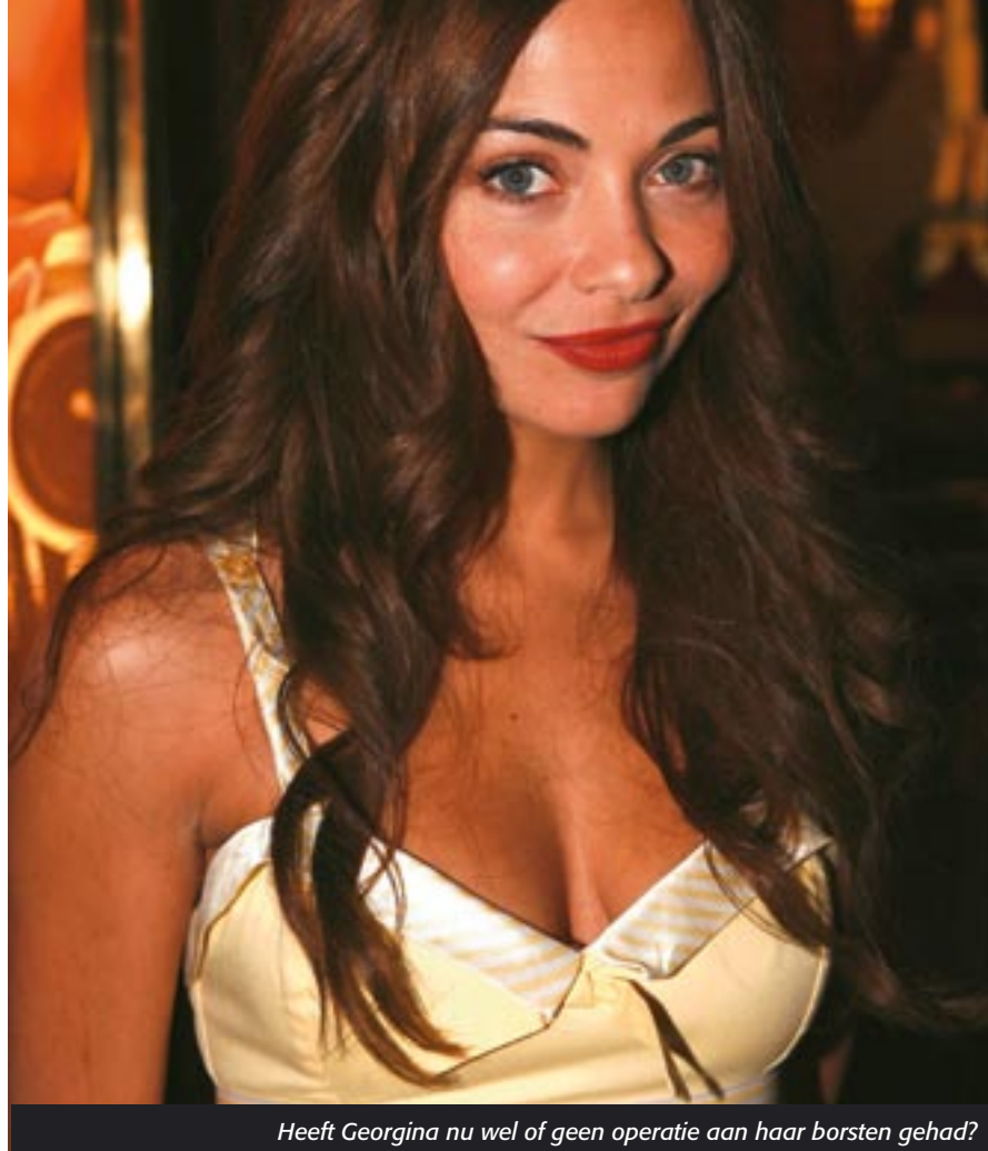
Heeft Georgina nu wel of geen operatie aan haar borsten gehad?

Maar liefst 52% is onzeker over haar borsten